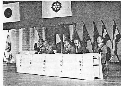
舞台上右側の特別来賓