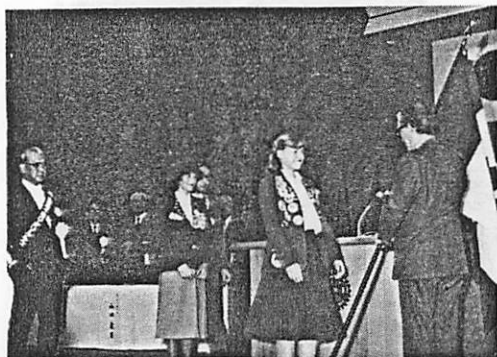
カナダ国旗の贈呈