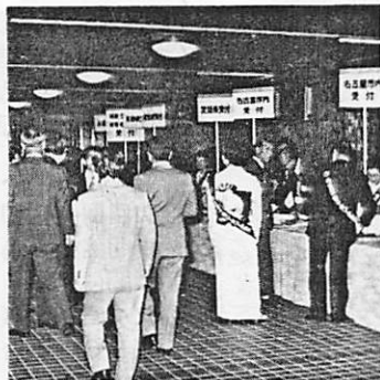
来場者の受付を行う会員