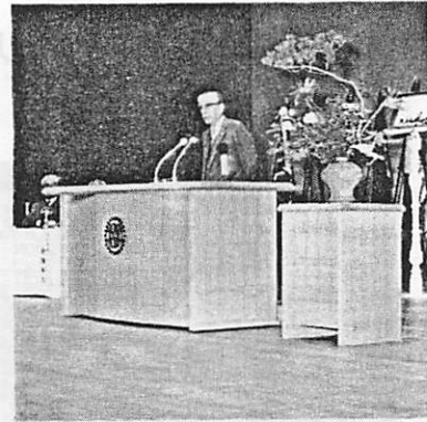
祝辞を述べるガバナー