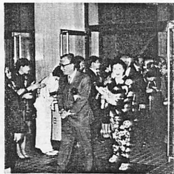
会員より見送りを受けるガバナー 夫妻