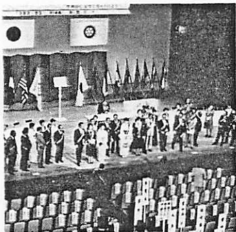
舞台上で紹介を受ける会員夫妻