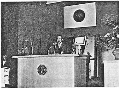
祝辞を述べる仲谷愛知県知事