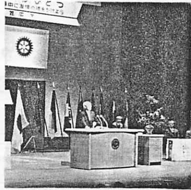
余語特別代表の挨拶および設立経過報告