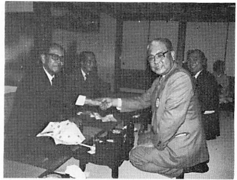
来賓者余語特別代表、相羽尾張第一分区代理、石塚東RC会長、伴東RC幹事を交えて、和気あいあいのうちに進行しました。

9年前の写真は、相羽分区代理、水野会長のお姿を、若々しいハンサムな美男子に写しておられました。