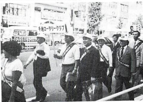
パレードする会員

去る9月20日、千種区内、秋の交通安全総決起大会及びパレードが開催されました。好天にも恵まれ、多数の会員を始め700余名の区民の参加により盛大に行われました。今後の交通安全に対する注意を、十分に喚起でき