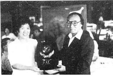
(優勝し楯を受けとる黒須夫人)