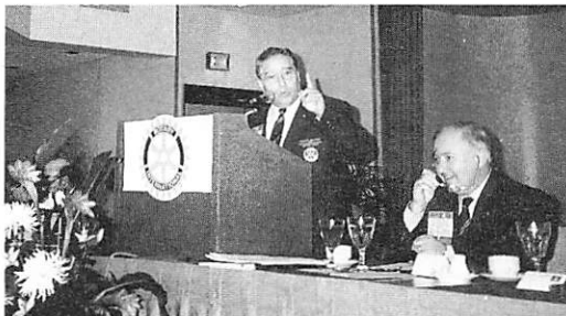
コスタ会長エレクト昼食会スピーチ

8月は会員増強月間、9月は青少年活動月間です。興味あるプログラムで月間を盛り上げるよう準備して下さい。