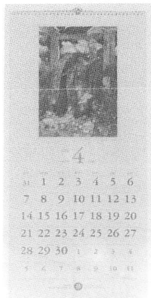
ロータリー・カレンダー