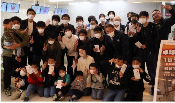
☆豚まんつくり&夕食会