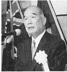
名古屋第二分区 大谷分区 代理より 挨拶