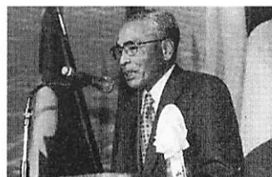
分区代理あいさつ