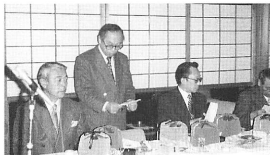
福豆・お札・絵馬を頂戴し楽しい夕食の宴へと続きました。