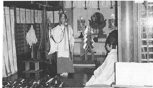
玉串を奉った後に巫女さんによる“浦安舞”