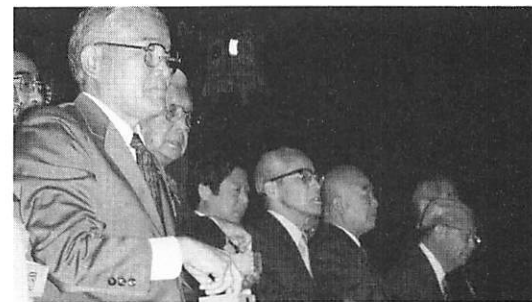
今年一年の無病息災を祈念して「鬼は外!! 福は内!!」