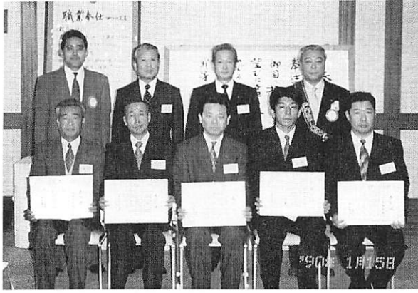
賞状及び記念品贈呈