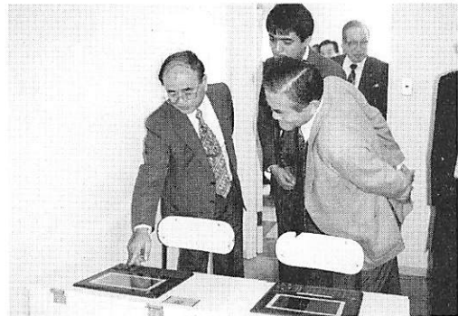
模擬試験もコンピューターでうけられるという近代化した設備に驚かれる会員の皆さん。

いずれにしても、自動車学校の役割は「いついかなる場合にも常に安全運転行動のとれるドライバー」を養成することであり、ただ単に検定や免許試験に合格させるだけの教習ではなく、免許取得後は交通ルールを守ることはもちろんのこと、常に思いやりや譲り合いの気持ちをもって、人にも車にも優しい運転のできるドライバーになるよう、会長の心を教習の場で生かすようさらに努力をして参りたいと考えております。