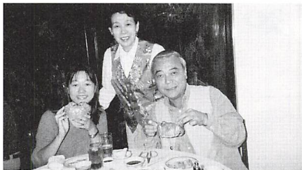
香港のレストランにて

そして、この留学中にたくさんのことを吸収して来年ひとまわりもふたまわりも大きくなって帰ってきた彼女にお会いできることを今から心待ちにしています。