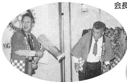
会長！ 半期無事終り、下半期に 願いをこめての一振りですか？

'99年最後の例会はアトラクションとしてお餅搗を企画。蒸したての餅米を会員自らの手により搗きあげました。出来たてのホヤホヤをそれぞれ大根おろしときな粉で頂き、お替わりの声も出る程の大好評。