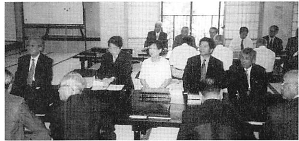
本堂より場所を移動し行われた例会では魚津社寺工務店と日泰寺の関わりなどの説明を受けた後、広大な敷地に建てられた建造物や庭を見学しました。