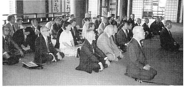
タイ国国王より日本国民への贈物として下賜された積尊金銅佛一軀が祀られた本堂にて、ご住職のお経とともに拝礼。