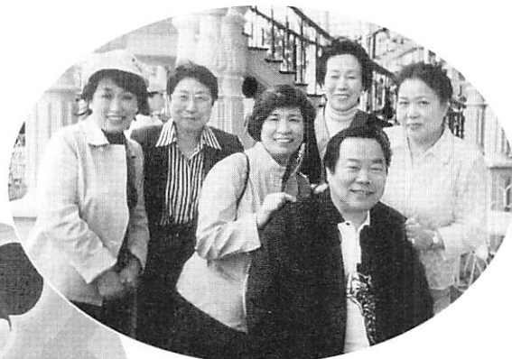
いつもは「ここで待っている」という会長も今回は奥様とたくさんの乗り物に！昼食後、美女に囲まれ照れ笑い。