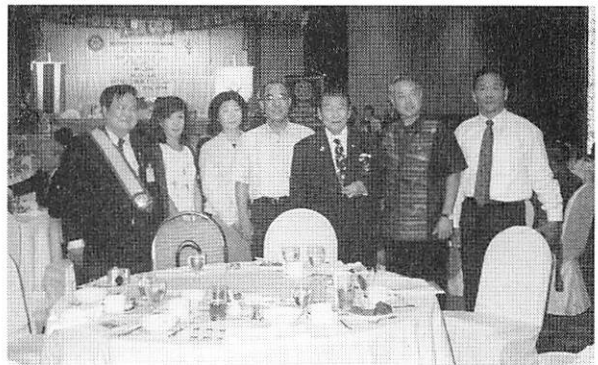
写真4 トンブリRCのメンバーと共に

そしてバナー交換をし、「RI会長所属クラブ」とプリン トされたトンブリRCのバナーを頂いて参りました。