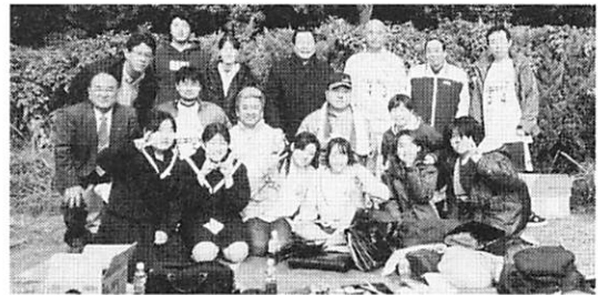
今年もオリジナルTシャツを作り参加