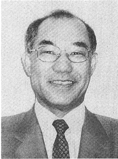
「今後は人材を育てるような部分に重点を」