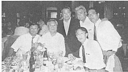
今年度ご活躍された執行部の方々と 次年度から忙しく？なられる方々

今宵は年度末を締めくくるのに相応しい素敵な会場ですので親睦を深め合い楽しい一夜となりますよう…。