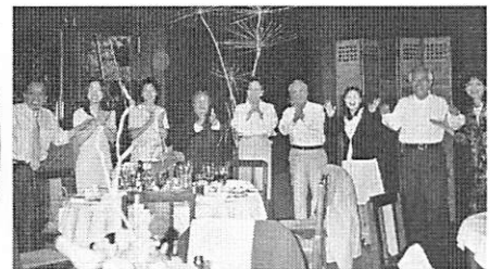
カメラを向けた途端、歌が終わっちゃった!