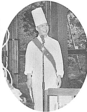
広島総料理長から今夜の美味しい 仏蘭西料理の説明を