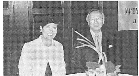
会長夫人として一年間お疲れ様でした