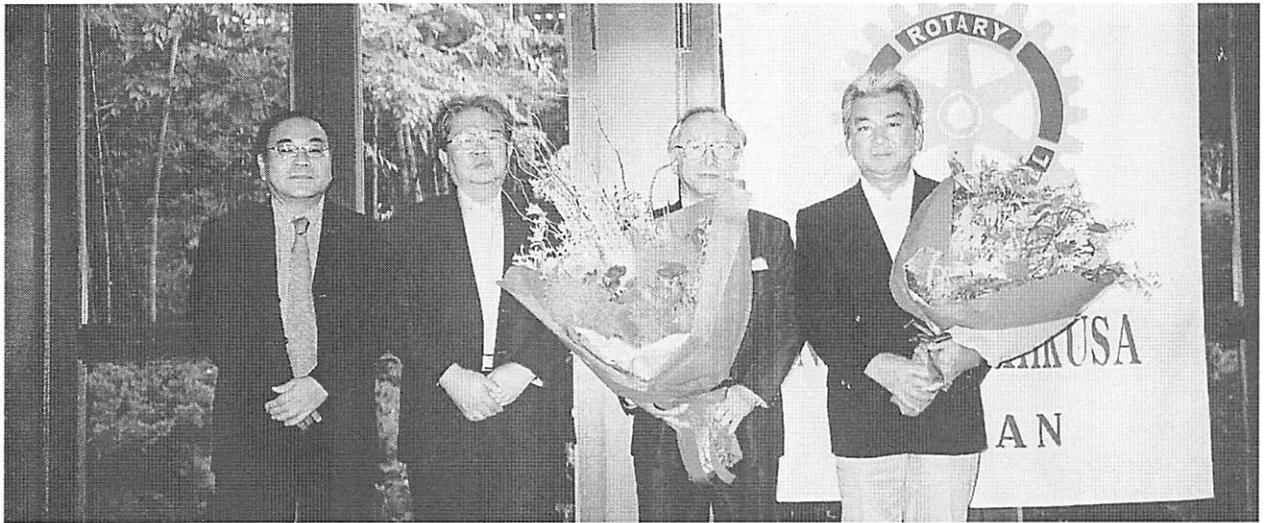
魚津エレクトと二村副幹事から、一年間の労をねぎらい花束を

最後にクラブと皆様の益々のご発展、ご健勝を祈念致しまして会長挨拶とさせていただきます。