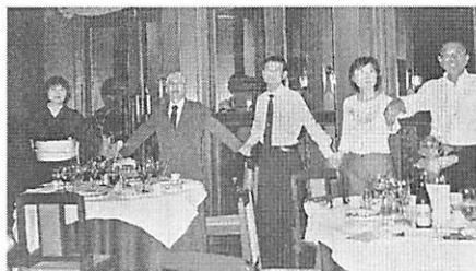
今年度最終例会は出席をと 仕事を済ませて駆けつけた方も