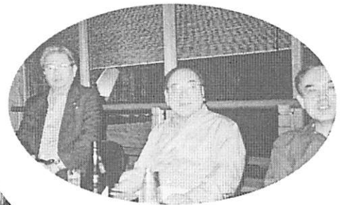
次年度の会長・幹事・副会長 来年も楽しい予定を！