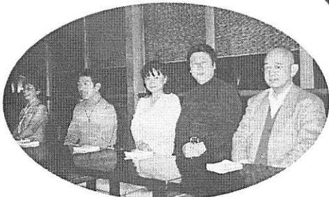
日頃お忙しい方々も