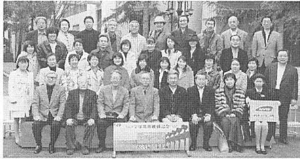
宝塚劇場にて全員でニコリ

皆さんの日頃の心がけが良く、バスを降りるころには雨も止み、委員会の方々はホッと！