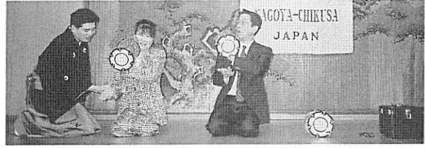
普段手にする機会の少ない和楽器だけに音を出すのに悪戦苦闘!!