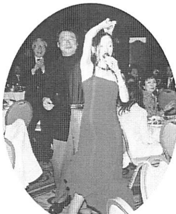
名古屋を代表するヒーリング ポップスシンガー尾崎真希さん のパワフルな声量と楽しい トークに思わずダンス