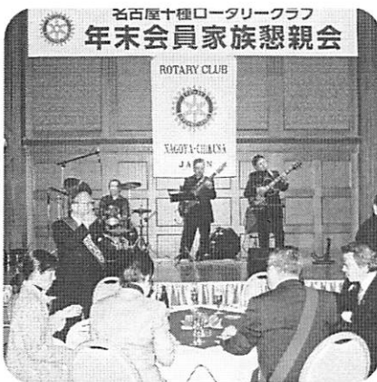
松居クラブ奉仕委員長の乾杯の後は バンド演奏をBGMに食事と歓談