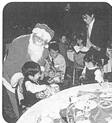
子供達のプレゼントを受け取る 様子に周りの大人達もニコリ