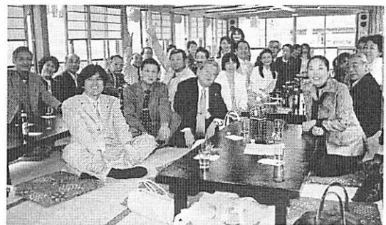
「大岡川の桜」屋形船にて

新横浜 ㊦バス → 鶴岡八幡宮 → 鎌倉山 ㊦(昼食) → 銭荒弁財天 → (11:00~12:00) (12:20~13:50) タクシー移動 (14:10~14:50) タクシー移動