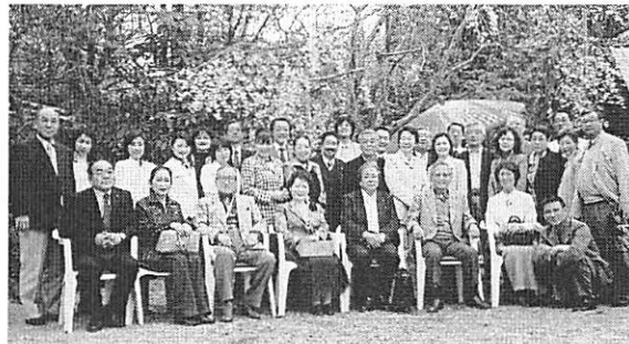
レストラン鎌倉山にて全員集合