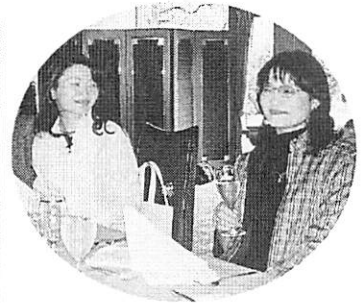
秋に結婚が決まり、お母さんと楽しい思い出に。