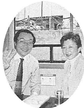
今日が結婚記念日30年イェーイ