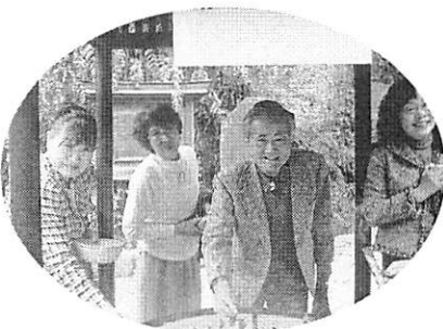
岩屋でお金を洗って参拝を