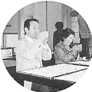
皇太子がお座りになった席?にて一服

昨日より東京にいらした方も含め新幹線新横浜改札口に9時50分全員無事集合となりいよいよバスにて出発!