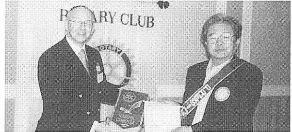
CAIRNS・MULGRAVEクラブとバナー交換

名古屋が第二の故郷となりますよう楽しみにしています。本日はありがとうございました。