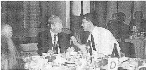
無事終わり感無量ですネ…