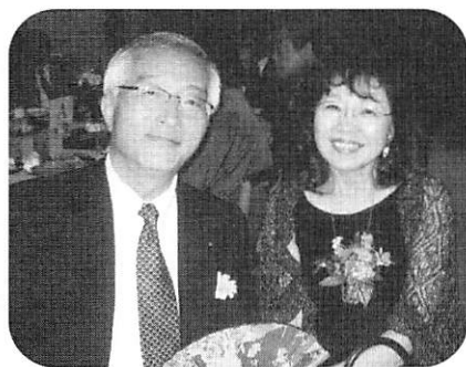
ホッとされた宮尾会長と夫人