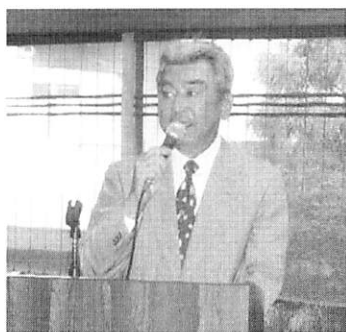
三好親睦委員長より挨拶