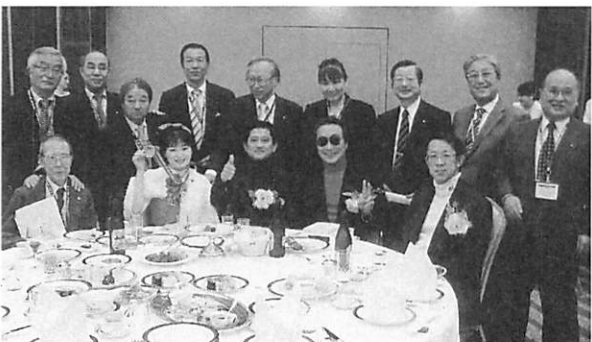
ハイ “本日はお疲れ様”

各クラブが自慢の歌（十八番）を披露した結果。優賞金メダルは名古屋錦RCの“ガキの頃のように”準優賞銀メダルは何と当クラブの“恋の片道切符”3位銅メダルは名古屋昭和RCの“吾亦紅”ガバナー賞は名古屋名東RCの“ゆうすげの恋”となりました。