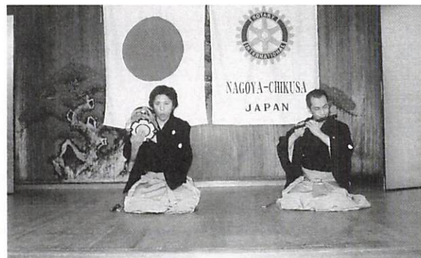
笛と鼓による小曲