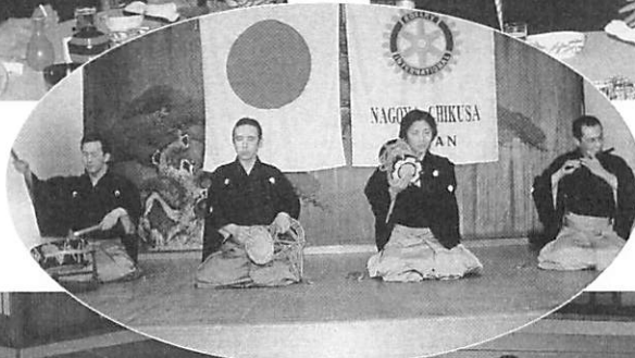
笛・大鼓・小鼓・太鼓の獅子の曲