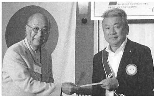
会長より活動運営補助金をお渡ししました。