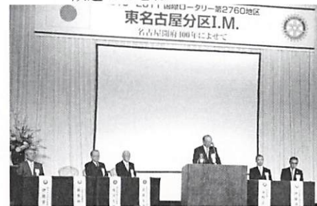
特別出席者並びに参加クラブ紹介