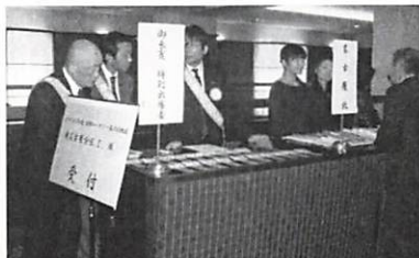
来賓受付・友愛の広場