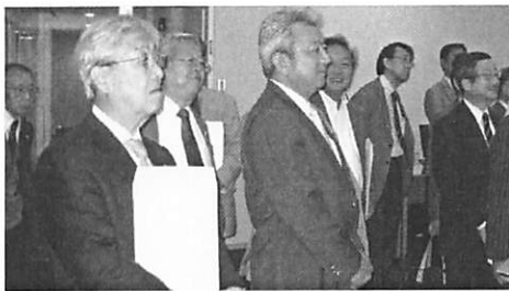
取引監視システム見学