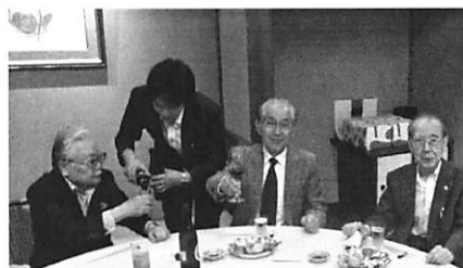
次年度よろしくお願ひ致します