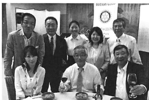
親睦の皆様おつかれさまでした！！