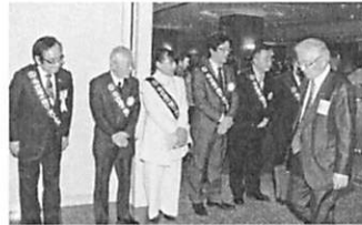
参加者をお迎えして、