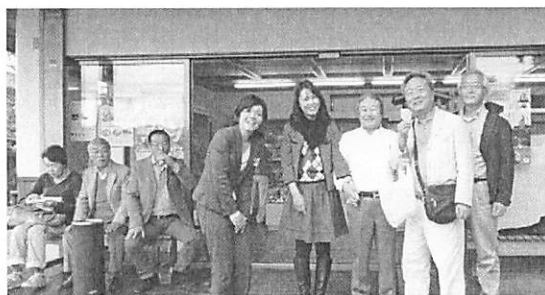
売店にてお留守番のご家族へのお土産を買って