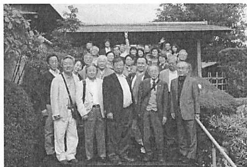
料亭三好 天龍膳 皆さんお腹いっぱい笑顔で～す