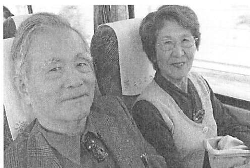
今日は奥様もご一緒に嬉しそうですね