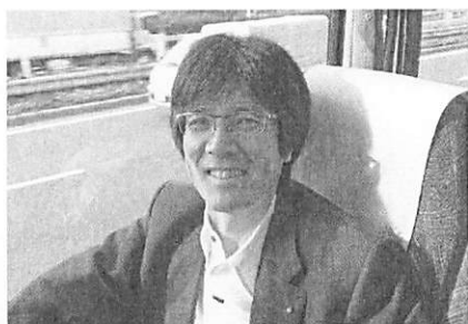
幹事は家族会初めてのお一人で寂しそう？