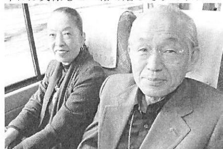
いつもお忙しいから今日のはんびりですね