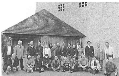
秋野不矩美術館にて