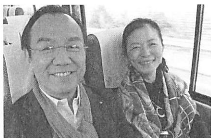
会長夫妻は残念ですが、名古屋へとんぼ返ししま～す