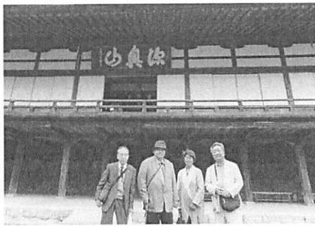
方広寺本堂前にて七宝の作品を見られて満足！！