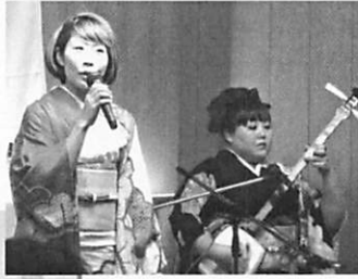
津軽三味線と和太鼓の アドリブセッションで 新年の御祝い ♪