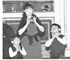
♪ 蝶ネクタイ 上手にできました！