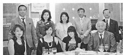
家族と一緒に皆さん素敵な笑顔です！