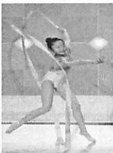
小さなレディー&ジェントルマンより