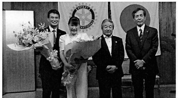
1年間お疲れ様でした！