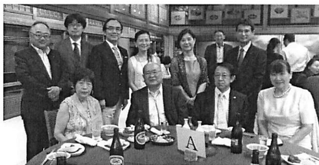
池森親睦委員長 1 年間お疲れ様でした