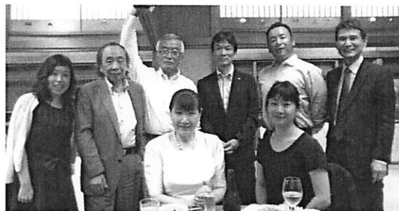
◆牧野副会長より閉会挨拶