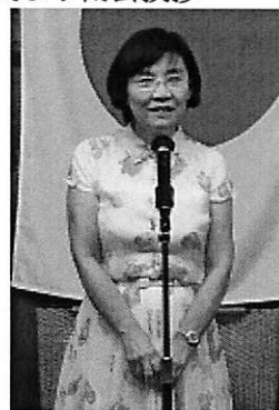
無事 2013-14 年度終了致しました