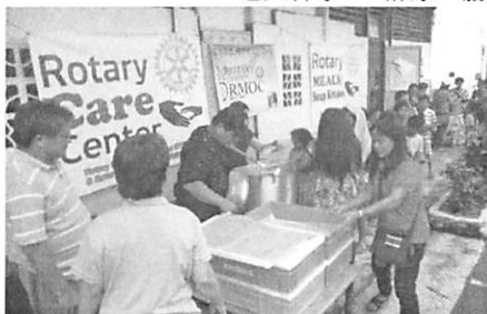
国際ロータリーケアセンター(レイテ島、オルモック市内)

2013年11月8日フィリピン(タクロバン)を直撃した台風30号は、1万人以上の死傷者を出しインフラ等もずたずたに破壊し甚大な被害をもたらしました。地区大会RI会長代理がフィリピンのアントニオ・ラフ