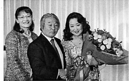
会長ご夫妻より花束を