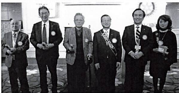
おめでとうございます