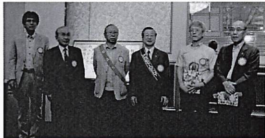
おめでとうございます