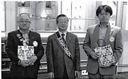
お誕生日おめでとうございます