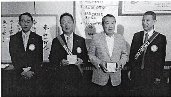
おめでとうございます