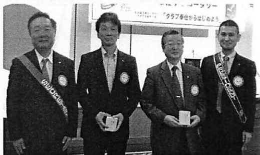
樫尾前会長 大谷前幹事 お疲れ様でした