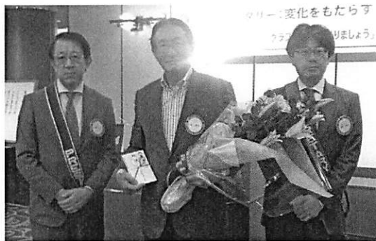
おめでとうございます