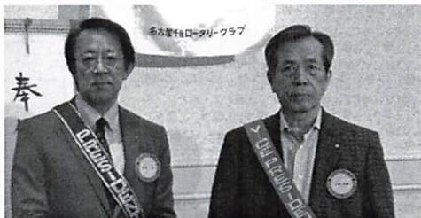
お誕生日おめでとうございます