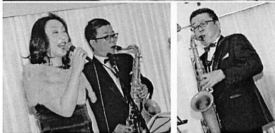
クリスマススタンダードナンバー、ボサバとオケliveを楽しみました