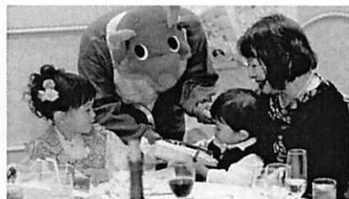
お子様たちへサンタクロースからのプレゼント！