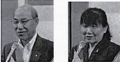
宜しくお願い致します