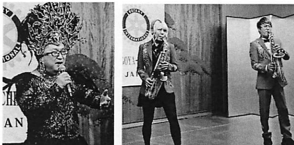
賑やかなアトラクションで盛り上げていただきました