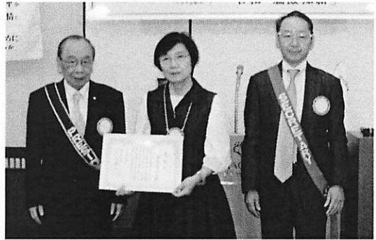
千種 RC 在籍 20 年表彰 おめでとうございます