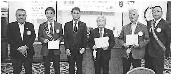
米山記念奨学会特別個人寄付 米山功労者への感謝状 および第22回米山功労クラブ表彰

小山米山奨学委員長より/ 10月の米山月間には、26名の会員の方にご寄付をいただきました。今期目標額 525,000 円に対し 605,000 円のご寄付を頂き、誠にありがとうございました。皆様のご協力に感謝申し上げます。