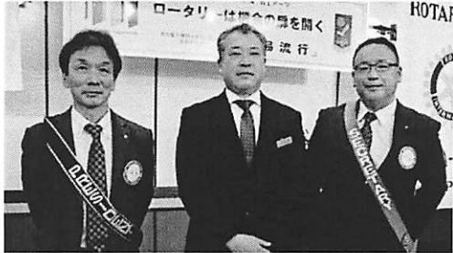
いつもありがとうございます